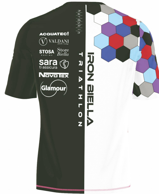
FRONT VIEW BACK VIEW