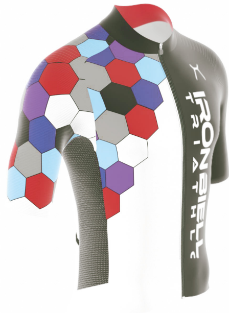
SIDE VIEW RIGHT SIDE VIEW LEFT