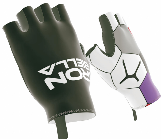
SIDE VIEW RIGHT SIDE VIEW LEFT