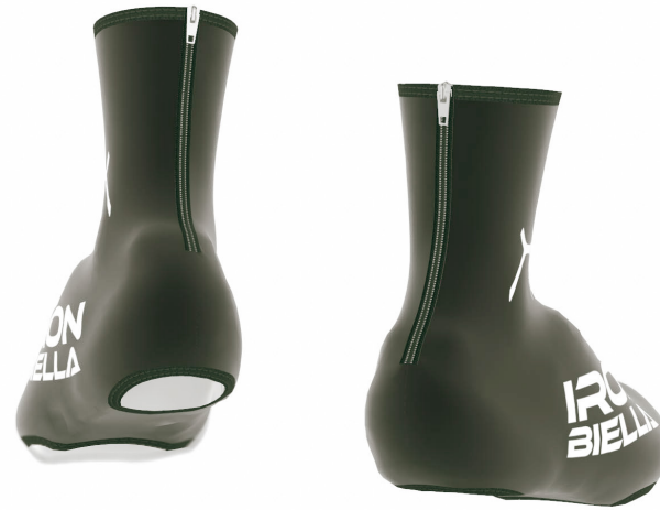
FRONT VIEW BACK VIEW