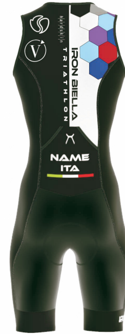
FRONT VIEW BACK VIEW