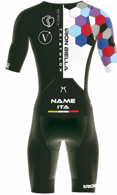
FRONT VIEW BACK VIEW