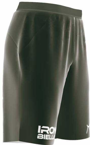
SIDE VIEW RIGHT SIDE VIEW LEFT