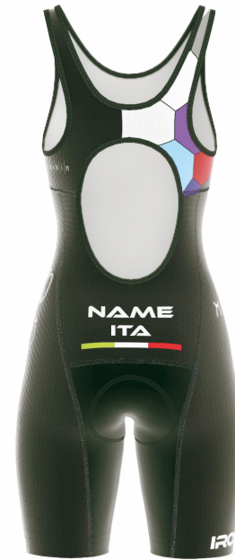
FRONT VIEW BACK VIEW