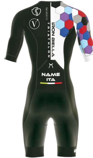
FRONT VIEW BACK VIEW