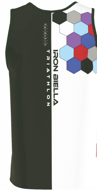
FRONT VIEW BACK VIEW