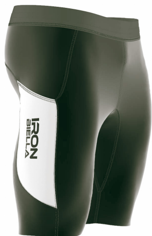
SIDE VIEW RIGHT SIDE VIEW LEFT