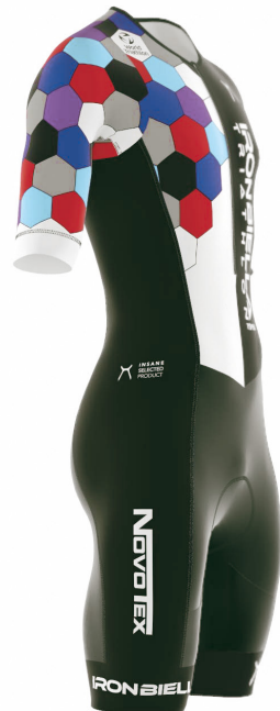
SIDE VIEW RIGHT SIDE VIEW LEFT