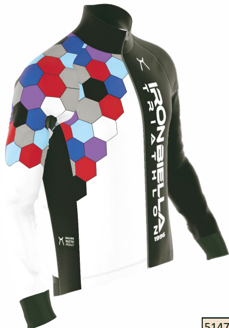
SIDE VIEW RIGHT SIDE VIEW LEFT