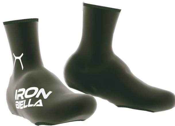
SIDE VIEW RIGHT SIDE VIEW LEFT