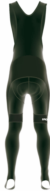
FRONT VIEW | BACK VIEW