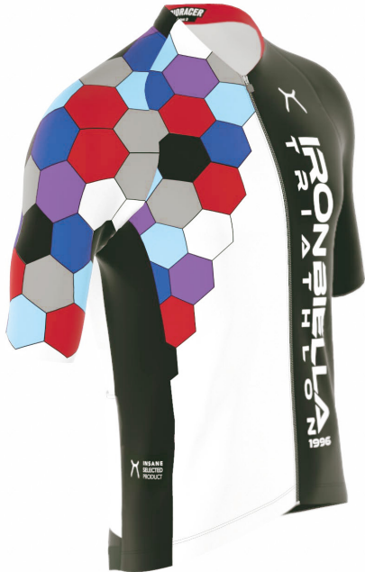
SIDE VIEW RIGHT SIDE VIEW LEFT