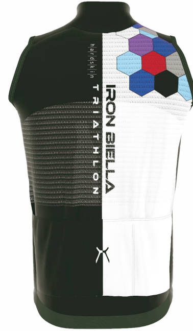
FRONT VIEW BACK VIEW