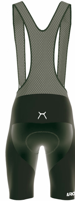
FRONT VIEW BACK VIEW