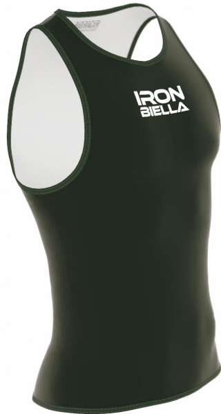
SIDE VIEW RIGHT SIDE VIEW LEFT