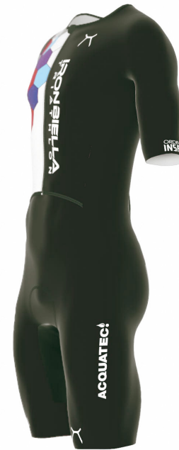
53811 TRI TEAM SUIT KIT