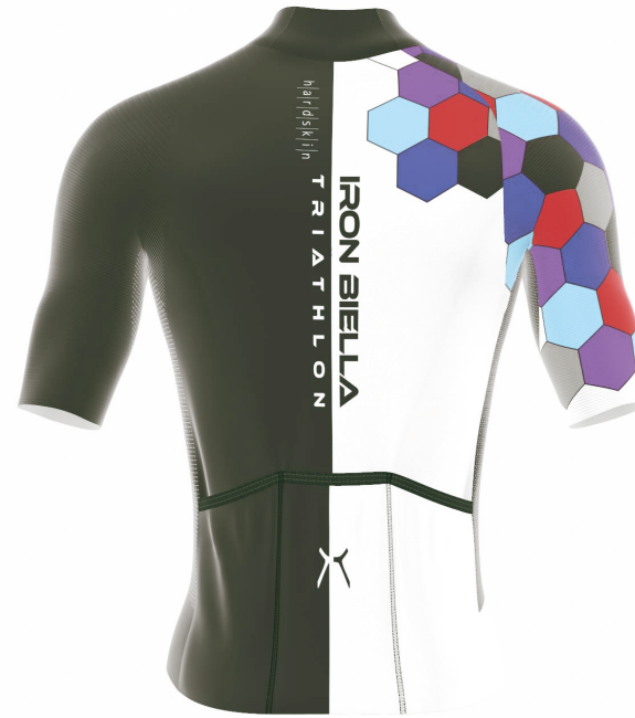
FRONT VIEW BACK VIEW