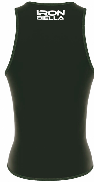
FRONT VIEW BACK VIEW