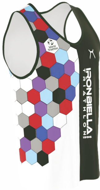
SIDE VIEW RIGHT SIDE VIEW LEFT