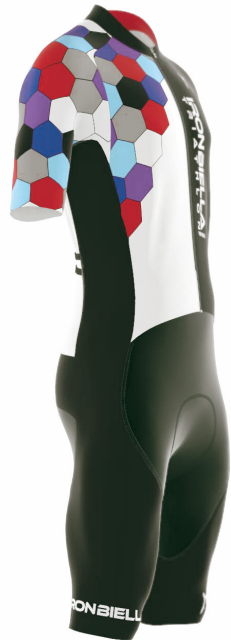
SIDE VIEW RIGHT SIDE VIEW LEFT