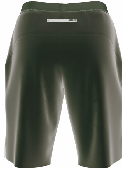
FRONT VIEW BACK VIEW