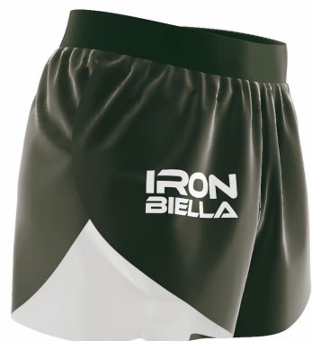
SIDE VIEW RIGHT SIDE VIEW LEFT