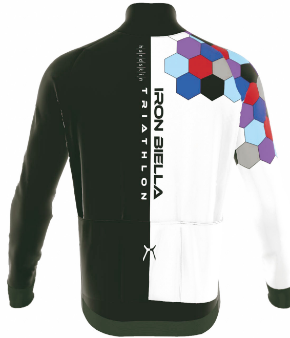
FRONT VIEW BACK VIEW