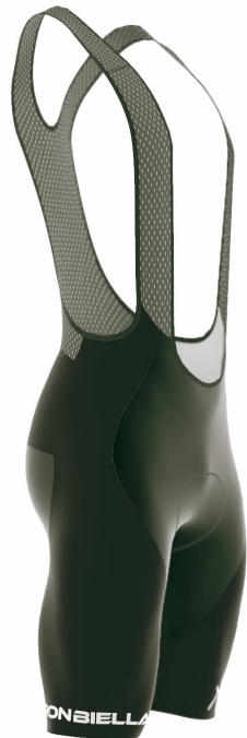
SIDE VIEW RIGHT SIDE VIEW LEFT