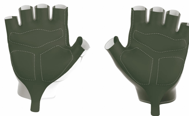
FRONT VIEW BACK VIEW