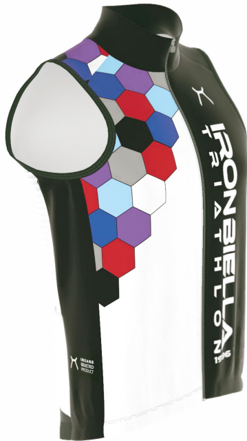
SIDE VIEW RIGHT SIDE VIEW LEFT