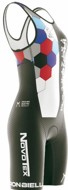
SIDE VIEW RIGHT SIDE VIEW LEFT