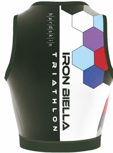
FRONT VIEW BACK VIEW