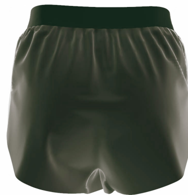
FRONT VIEW BACK VIEW