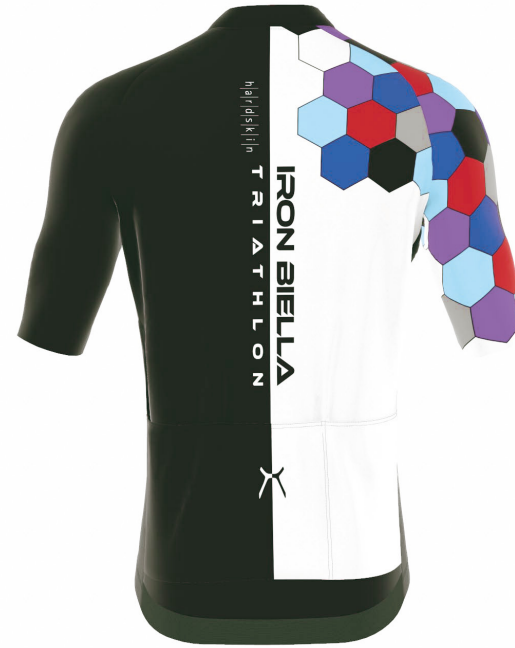
FRONT VIEW BACK VIEW