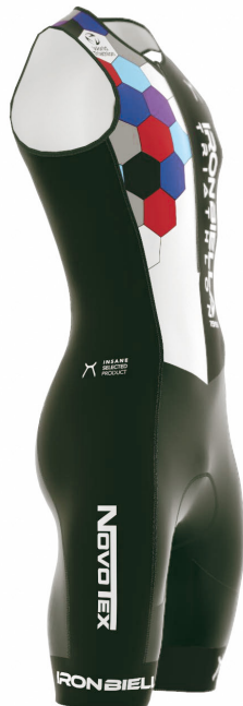
SIDE VIEW RIGHT SIDE VIEW LEFT