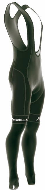
SIDE VIEW RIGHT | SIDE VIEW LEFT