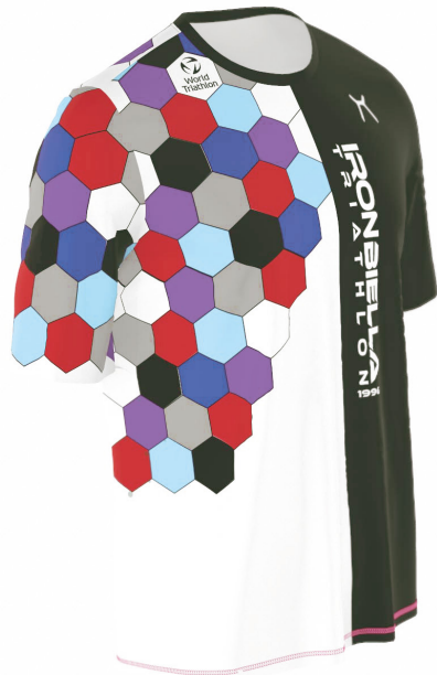
SIDE VIEW RIGHT SIDE VIEW LEFT