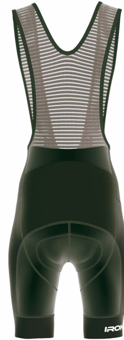
FRONT VIEW BACK VIEW