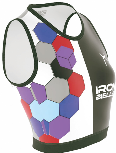
SIDE VIEW RIGHT SIDE VIEW LEFT