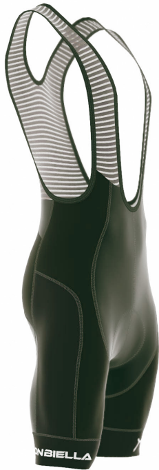
SIDE VIEW RIGHT SIDE VIEW LEFT